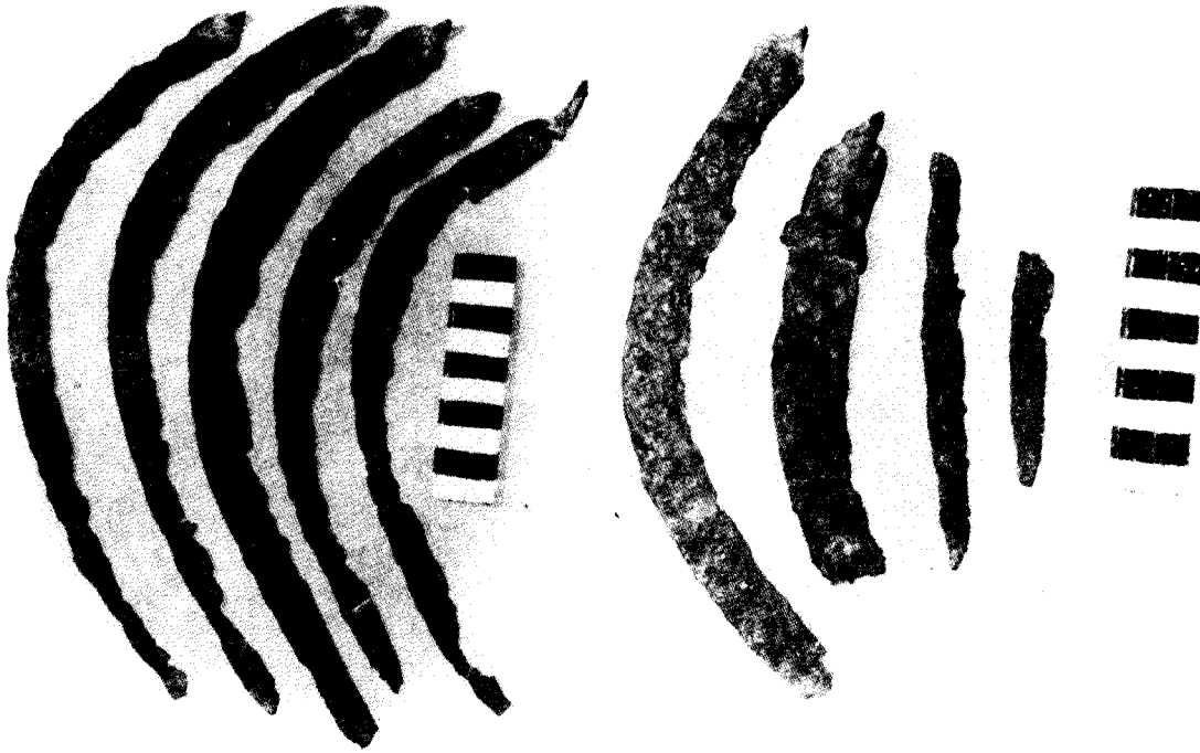
Fig. 1. Brăzdare de plug, seceri și cuțite din fier din tezaurul de la Căpîlna (foto).